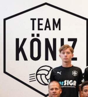
TEAM KÖNIZ FE-14