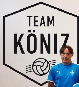
TEAM KÖNIZ FE-12