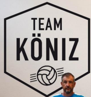
TEAM KÖNIZ FE-13