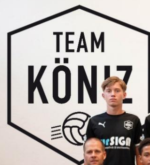
TEAM KÖNIZ U-15